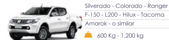
Silverado - Colorado - Ranger F-150 - L200 - Hilux - Tacoma Amarok - o similar 600 Kg - 1,200 kg