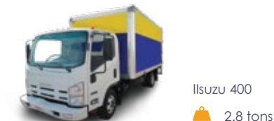
Isuzu 400 2.8 tons