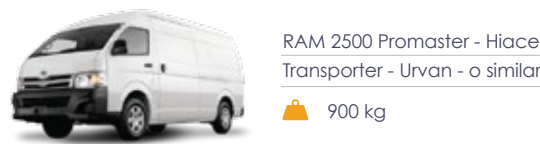
RAM 2500 Promaster - Hiace Transporter - Urvan - o similar 900 kg