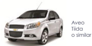
Aveo Tiida o similar