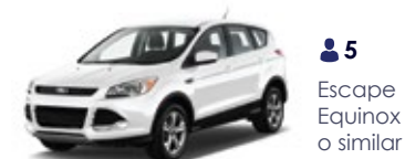
5 Escape Equinox o similar