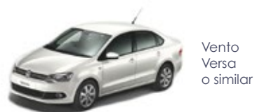
Vento Versa o similar