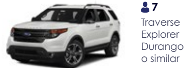
7 Traverse Explorer Durango o similar