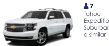
7 Tahoe Expedition Suburban o similar