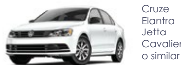
Cruze Elantra Jetta Cavalier o similar