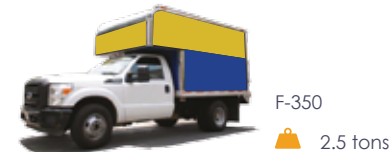
F-350 2.5 tons