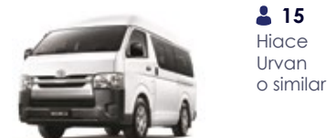
15 Hiace Urvan o similar